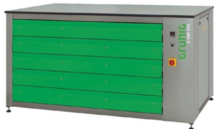
G-DRY 550 Horizontal Etuve de séchage pour écrans