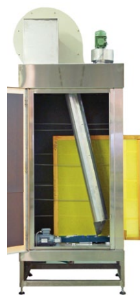
G-LINE 179 IN-LINE Module de soufflage