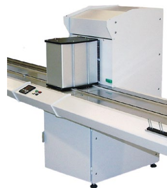
G-LINE 650 Séchage IN-LINE pour des alimentateurs CD