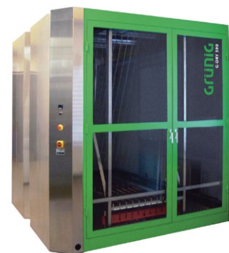
G-DRY 590 Armario secador IN-LINE para pantallas