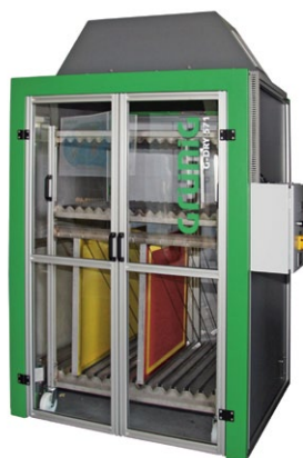
G-DRY 571 Armario secador vertical para pantallas