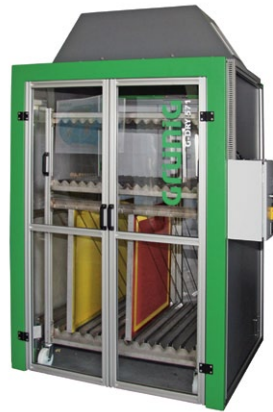
G-DRY 571 Vertikal Siebtrockenschrank