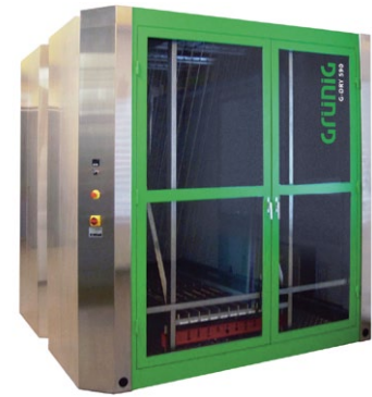
G-DRY 590 IN-LINE Siebtrockenschrank