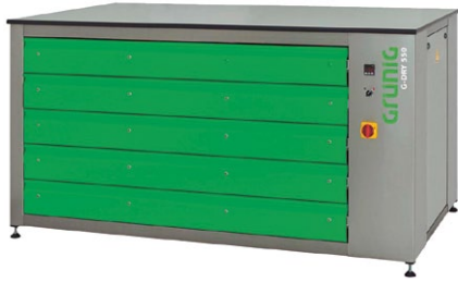
G-DRY 550 Horizontal Siebtrockenschrank