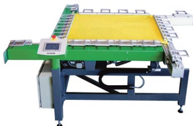
G-STRETCH 270A Elektromechanisches Spanngerät