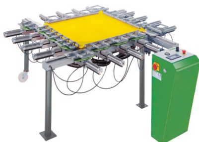
G-STRETCH 215A Pneumatisches Spanngerät