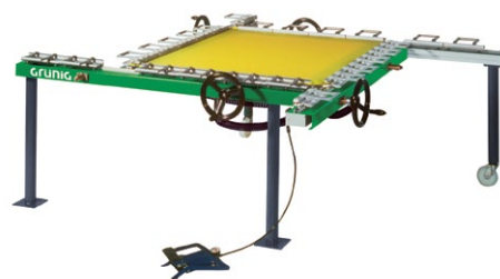
G-STRETCH 210 Mechanisches Spanngerät