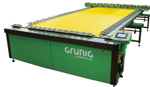
G-STRETCH 281A Grossflächen-Spannmaschine XL