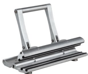
G-STRETCH 201 Spannkluppe DUPLEX