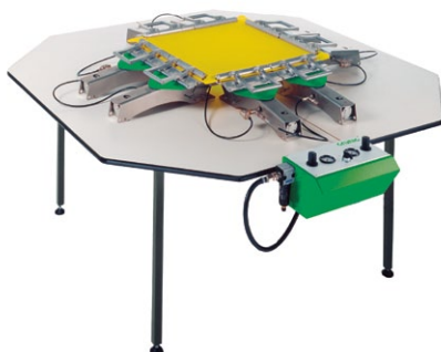
G-STRETCH 202 Pneumatische Spannkluppe