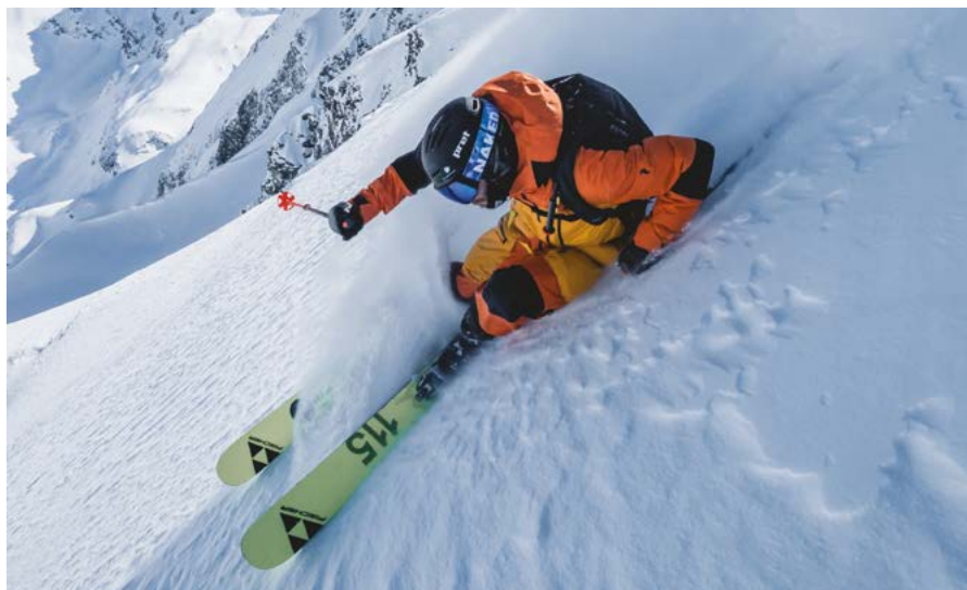
“我们非常重视以专业手法将产品设计应用到滑雪板上”。