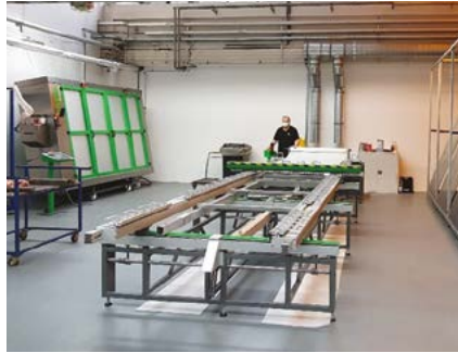
自动化丝网清洗和绷网流程

续不断的流程改进。在社会可持续性方面，菲舍尔特别重视员工福祉、职能培训和继续教育以及员工安全。